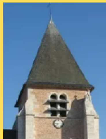
église de Sennely