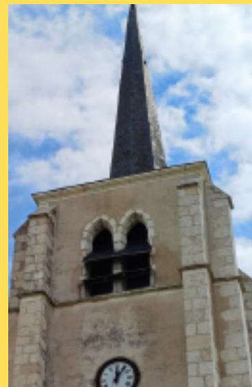
église de Marcilly en Vilette

• Samedi 5 Juin - 18H - 1ère communion des jeunes du groupement à Marcilly