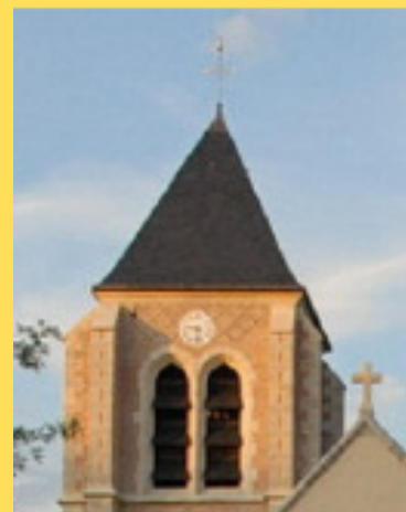
église de Méneestreau en Vilette