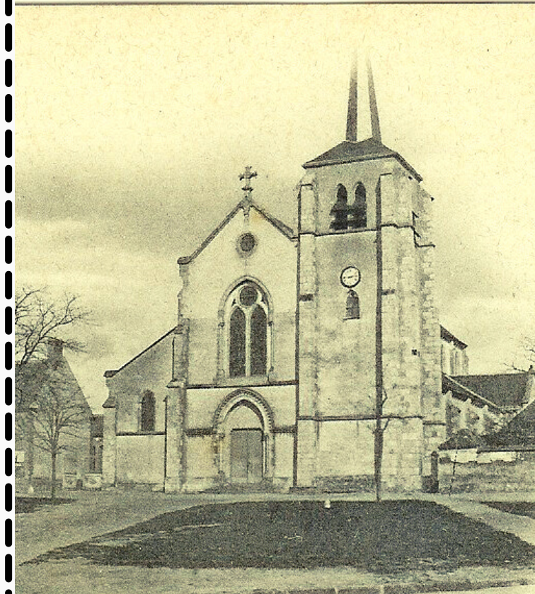
L'église au début du 20ème siècle

"En 1866 le curé de Marcilly-en-Villette, l'abbé Gillet, propose à la mairie un plan et un devis de réparation et d'agrandissement de l'église. La dépense est évaluée à 35.000 francs. Une souscription lancée auprès des habitants fournit 20.000 francs. Le conseil municipal accepte de s'endetter à hauteur de 7000 francs, avec une demande de subvention des 8000 francs manquants auprès de l'Etat. Après étude, il apparaît que le bâtiment est trop vétuste pour être restauré et agrandi. Un nouveau projet est présenté par l'architecte Benjamin RICARD; Il est approuvé en 1869. En juillet 1870, l'entreprise Berland démolit l'église. Un mois plus tard l'Empire bascule. Les troupes prussiennes occupent la moitié de la France, l'administration disparaît pour plusieurs mois. Marcilly se retrouve sans église pour plusieurs années. Finalement la première pierre est posée le 1er octobre 1871 par l'abbé Rabotin, vicaire général d'Orléans. Le gros œuvre terminé, l'église Saint-Etienne est consacrée le 15 août 1873. Grâce à la générosité de la famille d'AILLY, propriétaire du château d'Alosse, les peintures du chœur sont réalisées en 1889 par l'atelier CHENU d'Orléans qui a également réalisé les peintures des chapelles du chœur de la cathédrale d'Orléans. Ces peintures ont été cachées durant de très nombreuses années par des rideaux et nécessitent une rénovation complète que nous souhaitons concrétiser en cette année du 150ème anniversaire de la pose de la 1ère pierre